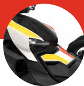
Heritage White IV